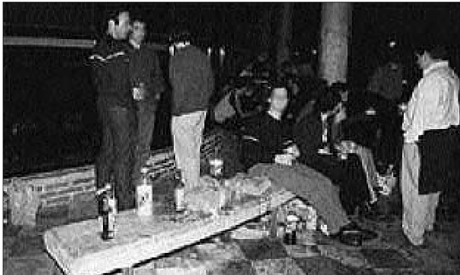
"Botellon"-a kalean dagoela argi dago, baina zein izango litzateke konponbidea?

Ikusten denez, iritzi oso ezberdinak daude, baina gehienek horren kontra kokatzen dira. Polemika hau inoiz baino handiagoa da. Ama batek esaten digun bezala "gero eta zarata gehiago egiten dute eta auzokoak kexatzen dira, eta sala-