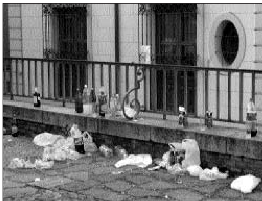
"Botellon" ostean geratzen diren arrastoak

Egileak: Naiara Alzola, Naiara Olave, Jorge Izquierdo